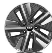
Llantas de aleación 16'' con embellecedor