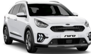
Clear White (sólido)