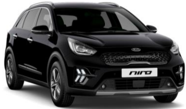
Aurora Black Pearl