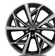
Llantas de aleación 18''