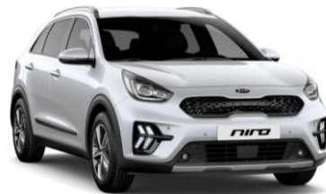
Snow White Pearl