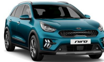
Deep Cerulean Blue