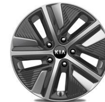
Llantas de aleación 16" con embellecedor