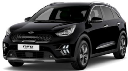
Aurora Black Pearl