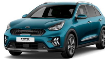
Deep Cerulean Blue