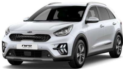
Snow White Pearl