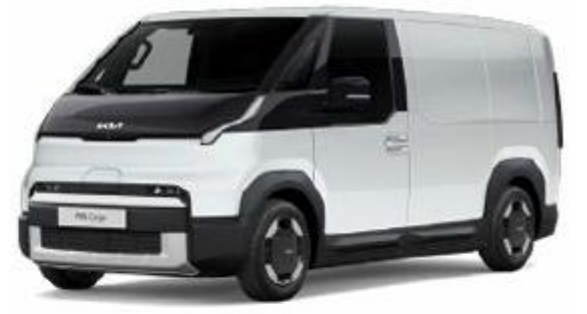
SWP-Snow White pearl