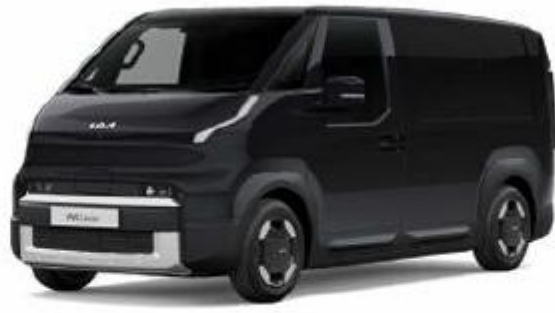
ABP-Aurora black pearl