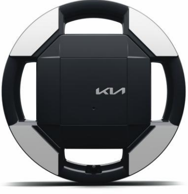
Llantas de aleación 16"