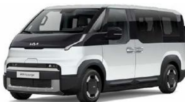
SWP-Snow White pearl