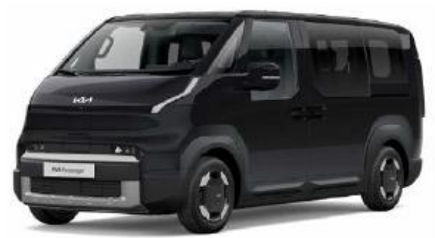
ABP-Aurora black pearl